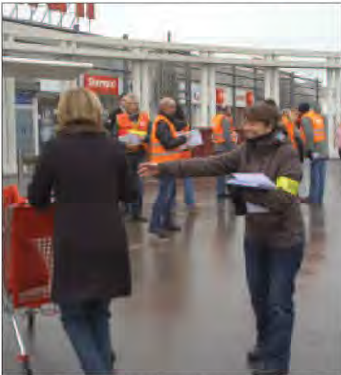
Une distribution de tracts à la population a été effectuée hier matin devant Auchan, à Grande-Synthe.

Les douaniers poursuivront leur mouvement à Lille avant les fêtes de Noël, avec une manifestation devant la direction interrégionale des douanes à Lille. ■