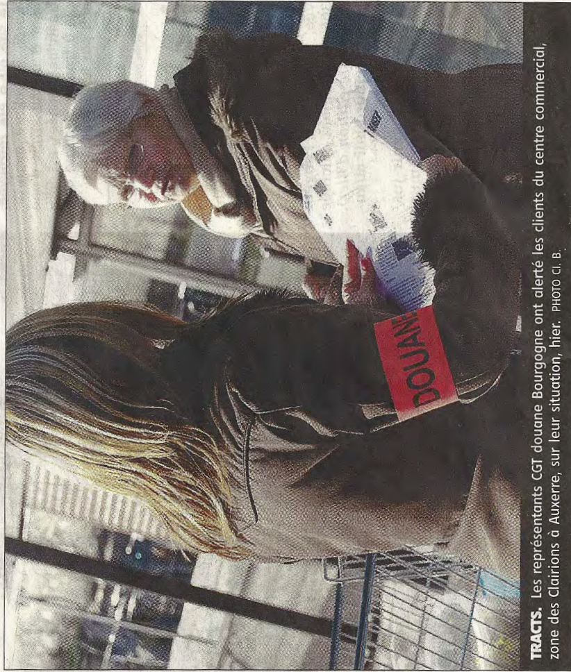
TRACTS. Les représentants CGT douane Bourgogne ont alerté les clients du centre commercial, zone des Clairions à Auxerre, sur leur situation, hier.

Certains clients s'arrêtent. Prennent quelques instants pour discuter. « Qu'est-ce que c'est ? C'est la douane ! Ils veulent vous supprimer aussi ? », lâche un peu interloqué un couple de personnes âgées. Avant de renchérir : « Nous, on n'est