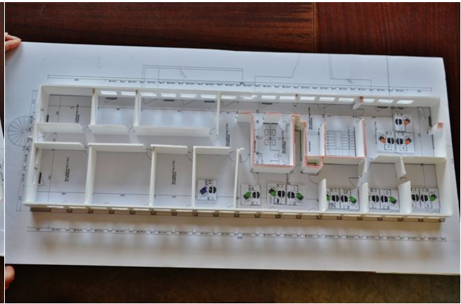
1er étage (CRD / Viti) Dallas

placer les services de la façon la plus cohérente possible mais surtout et malheureusement pour eux, de la façon qui nécessitait le plus de travaux. Et là, alors que tout le monde semblait à peu près satisfait du résultat, la dernière réunion de mardi a jeté un froid ! La direction a fait savoir qu'aucun travaux ne serait engagé pour le nouveau bureau. Les crédits ont été baissés de 7% et les travaux immobiliers gelés pour l'année 2013, effort de rigueur budgétaire oblige. L'enveloppe de 200 000 € allouée ne profitera qu'à l'installation de la BSI et les différents services de Dallas n'ont qu'à se redéployer dans les bureaux existants, quitte à ce qu'ils soient "éclatés". Quelle gageure ! Comment travailler dans de telles conditions ? Comment allons nous pouvoir exercer nos missions avec cohésion ?