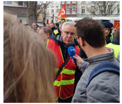
Arrivée à Dunkerque...