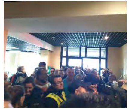
Arrivée à la DR..