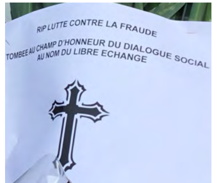
Cérémonie dans la cour de la DR...!

Les douaniers sont de nouveaux mobilisés. Ils organisent une opération escargot sur l'autoroute A16 avant de se rendre devant la direction régionale des douanes à Dunkerque pour exprimer leur colère. Les douaniers se sont donné rendez-vous sur le parking du centre commercial de Grande-Synthe. De là, ils comptent se rendre à la direction régionale des douanes, rue de Paris, à Dunkerque. Pour se faire remarquer, les douaniers ont décidé d'emprunter l'autoroute A16 pour s'y rendre, créant de fortes perturbations dans le sens Grande-Synthe vers Dunkerque